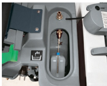
Système Hako-AquaControl : dispersion de la solution de nettoyage avec précision et efficacité. Économie d'eau et de produit de nettoyage. Gain d'autonomie.