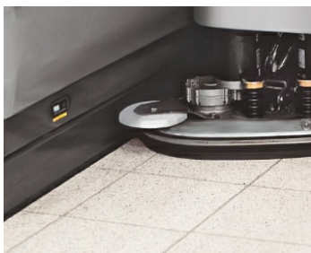
Brosses pouvant aller sous les étagères