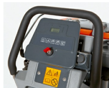
Ergonomie parfaite : travail sans fatigue grâce à des commandes à portée de main et une excellente visibilité. Commandes intuitives permettant de prendre en main la machine rapidement. Un seul geste suffit pour activer/désactiver toutes les fonctions.