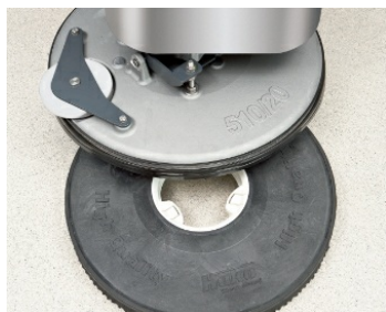
Accrochage et décrochage automatique des brosses (43 et 51 cm).